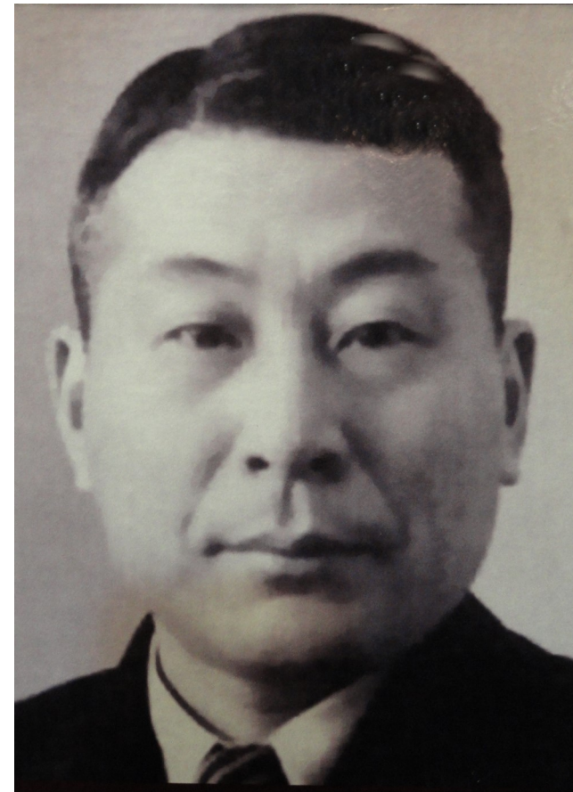
Chiune Sugihara 杉原千畝

1944年ハンガリー、ブダペストで自らの危険を顧みず数千人の命を救ったスウェーデン人外交官