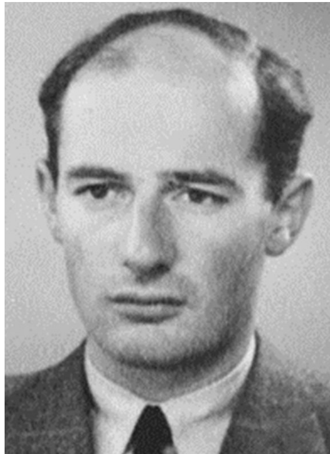
Raoul Wallenberg ラウル・ワレンバーグ

Swedish diplomat in 1944 in Budapest, Hungary, at great personal risk, saved thousands of lives